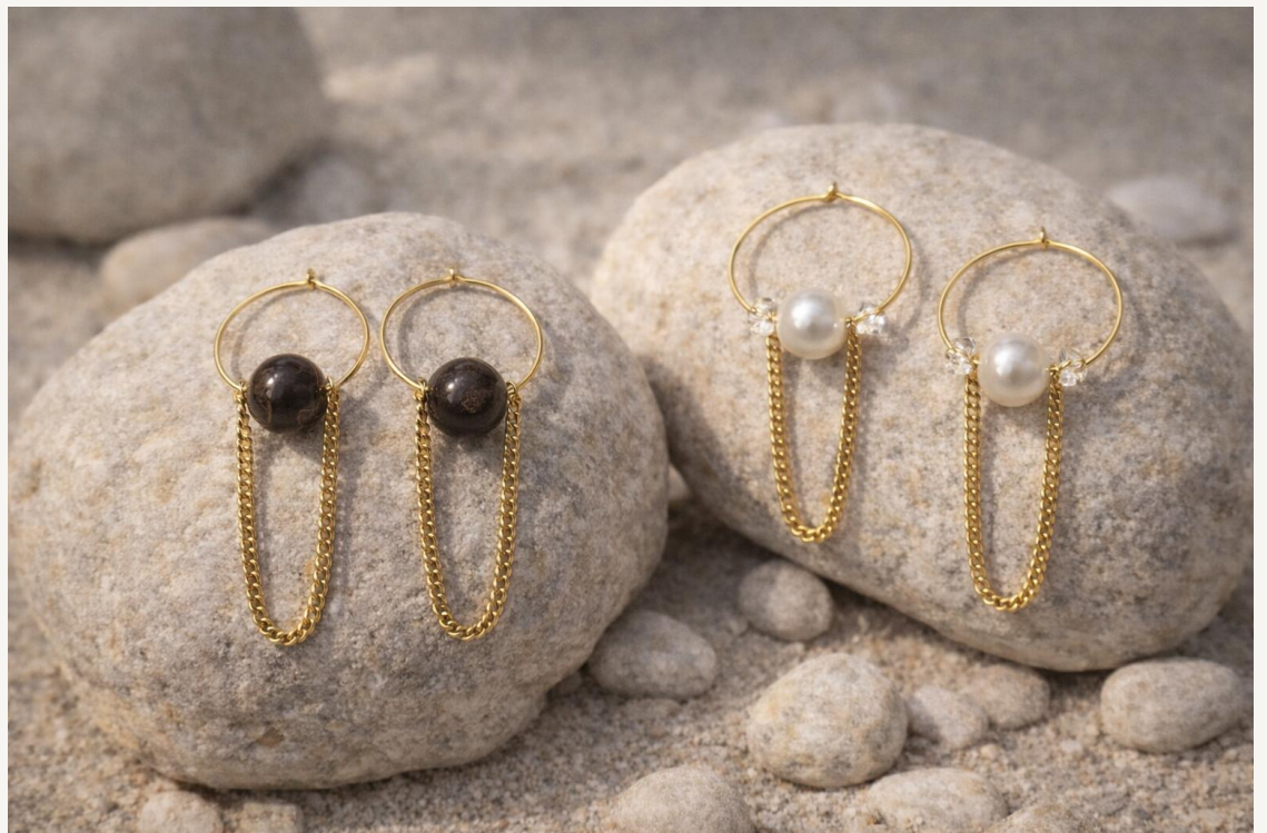
Criolla Eclipse con piedras naturales (dorado)