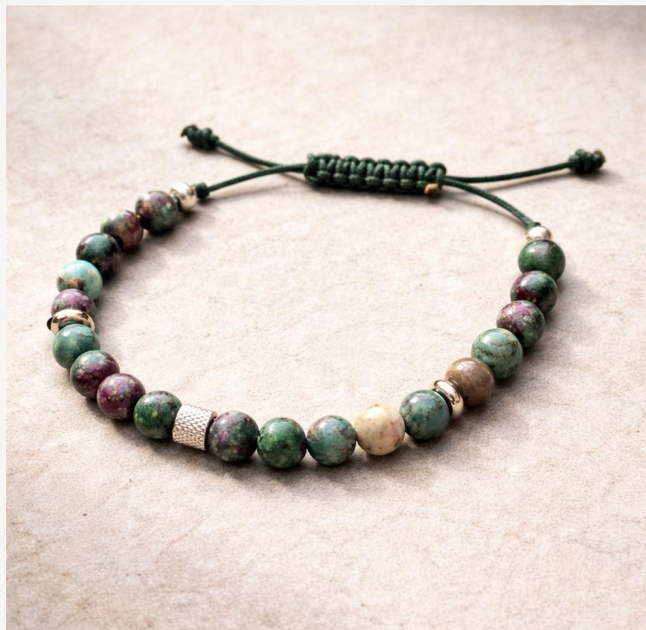
Pulsera Brisa Verde Jade