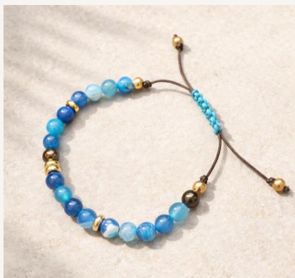
Pulsera Brisa Azul Agata