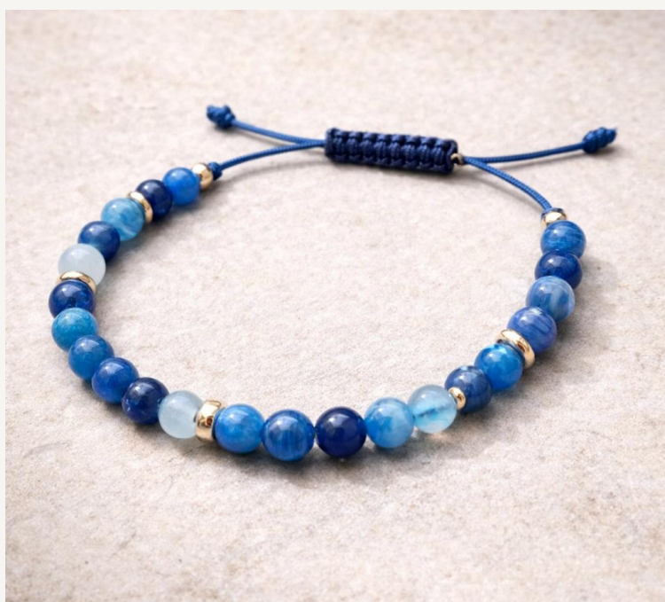
Pulsera Brisa Azul Agata