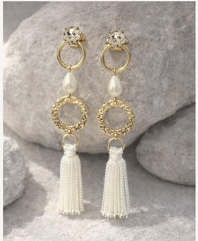
Pendiente Garra Eclipse (Dorado)