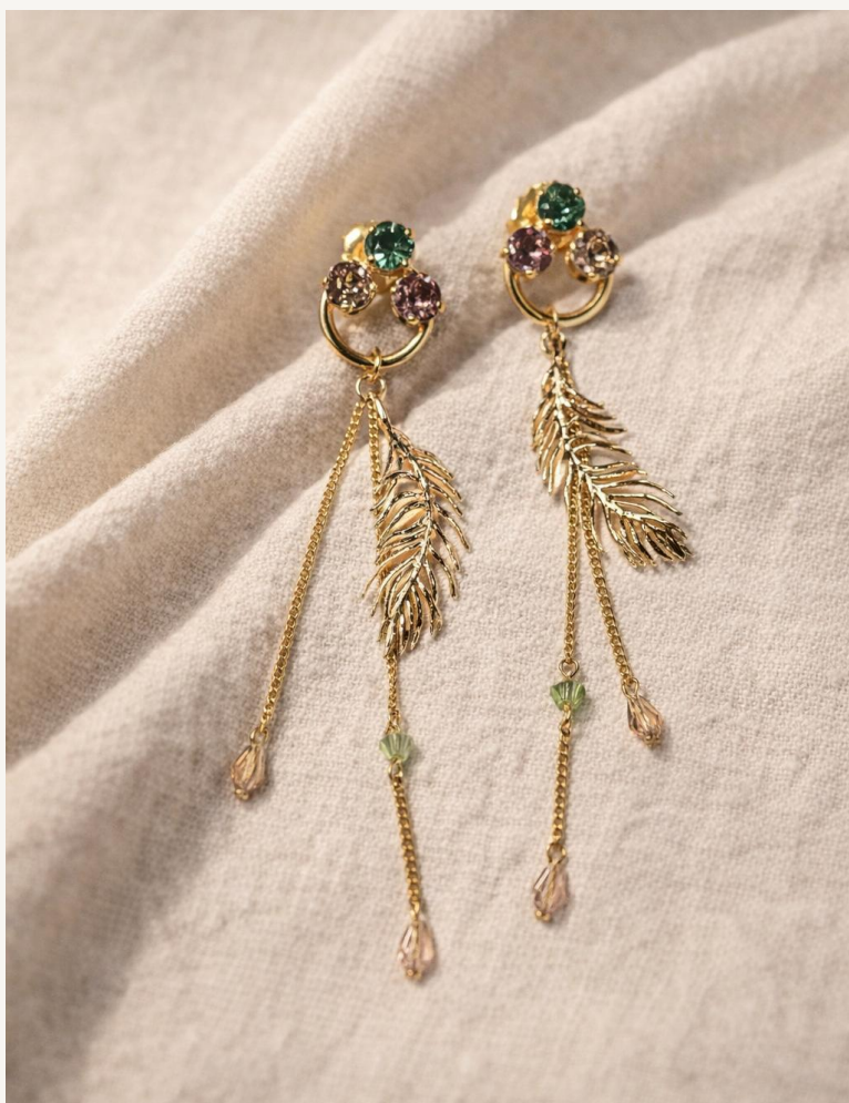
Pendiente 3 Garras y Pluma –R