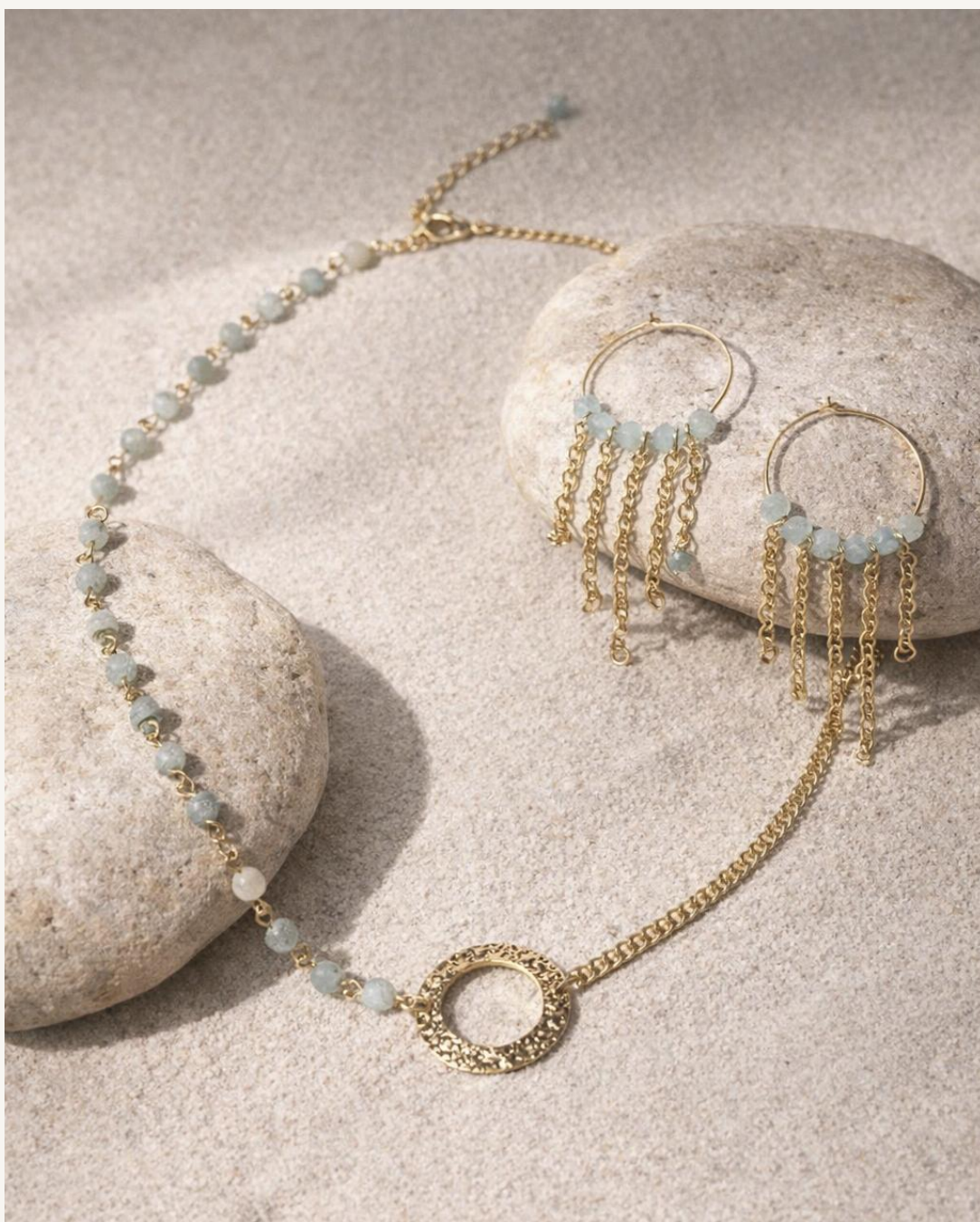
Gargantilla Eclipse (azulado)