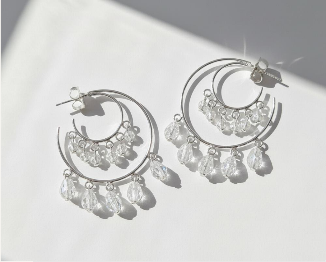
Aro Doble Plateado con Cristal Multicolor (*)