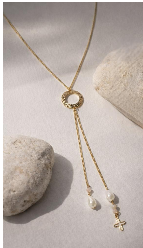
Gargantilla Doble, aro Troquelado y doble Cadena