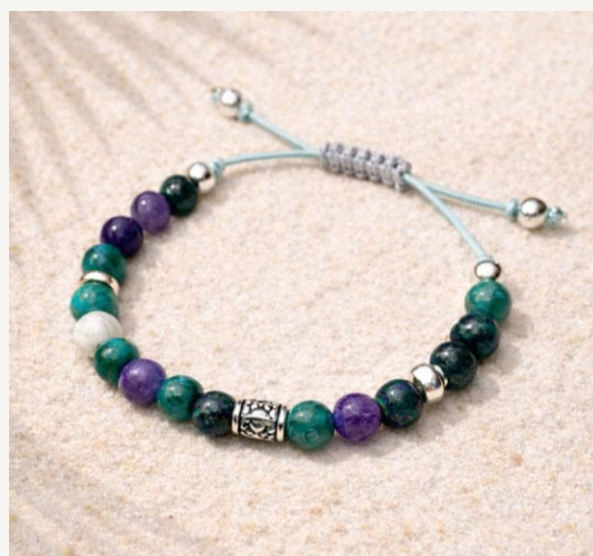
Pulsera Brisa Verde Jade