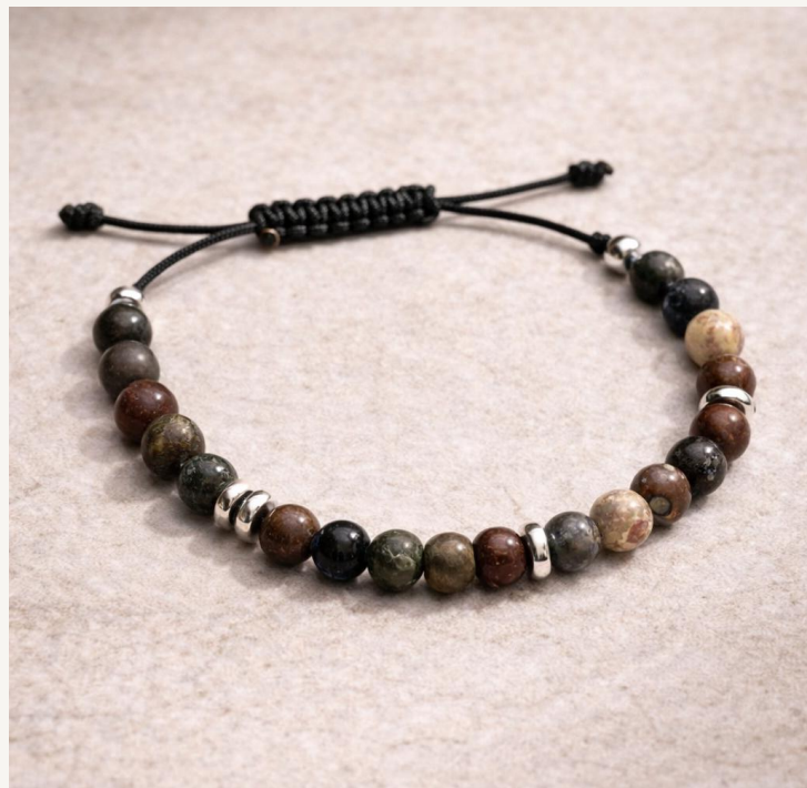
Pulsera Brisa Marrón Océano