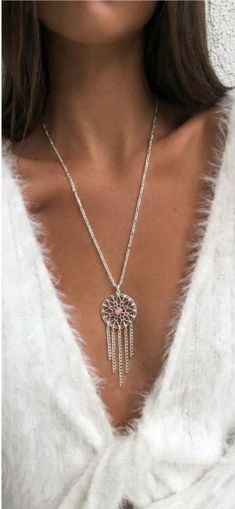
Collar con flor Atrapasueños y cristal Rosa