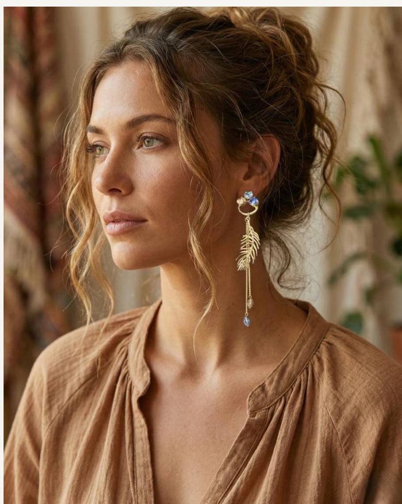
Pendiente 3 Garras y Pluma –A