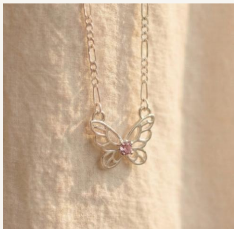
Gargantilla Mariposa geométrica con cristal Azul y/o Rosa