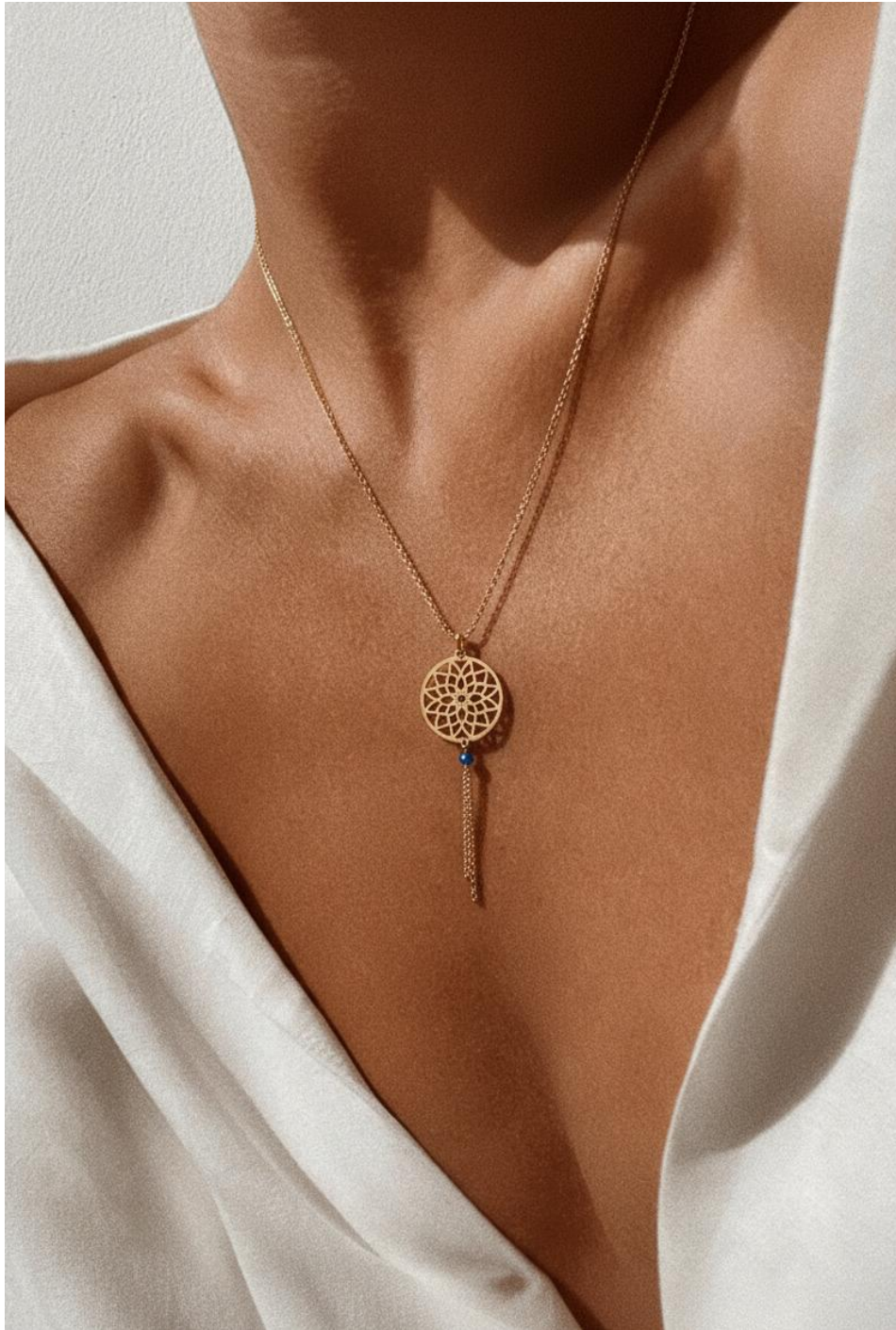
Gargantilla con Mandala y cristal azul