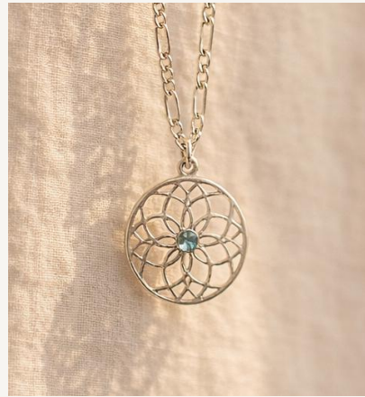
Gargantilla con Flor geométrica y cristal azul