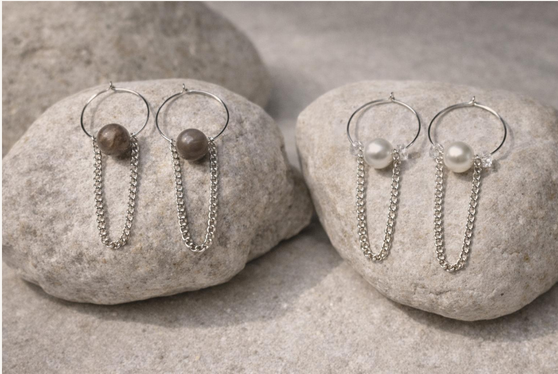
Criolla Eclipse con piedras naturales (plateado)