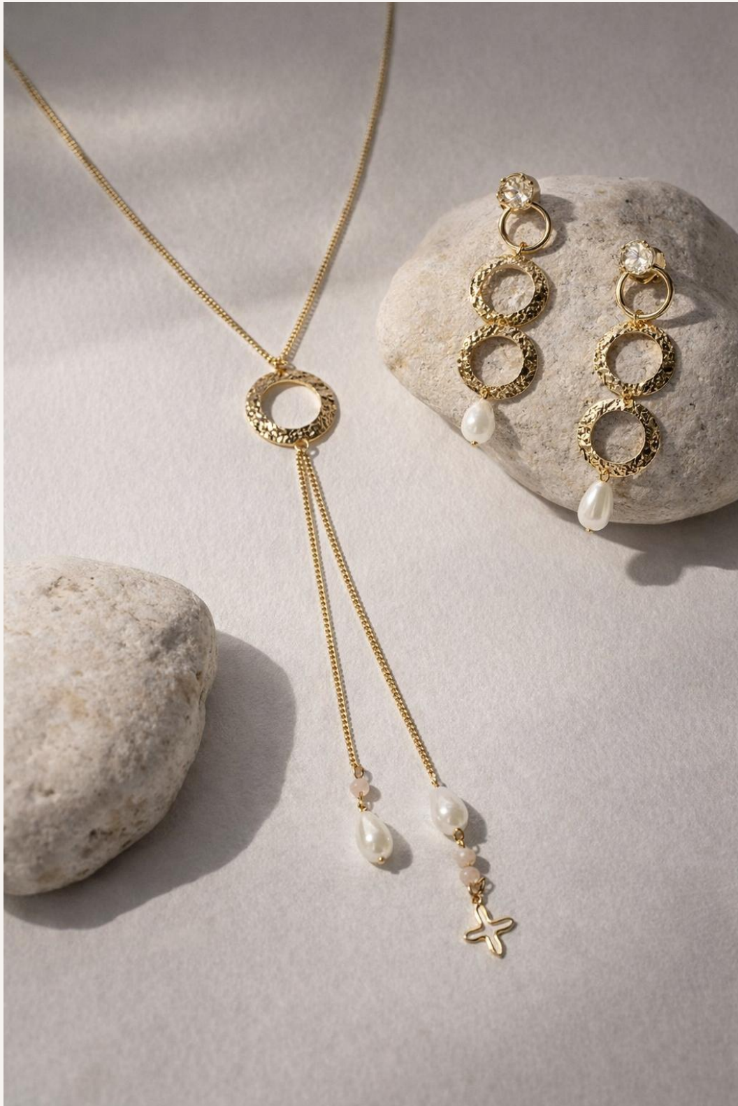
Gargantilla Doble, aro Troquelado y doble Cadena