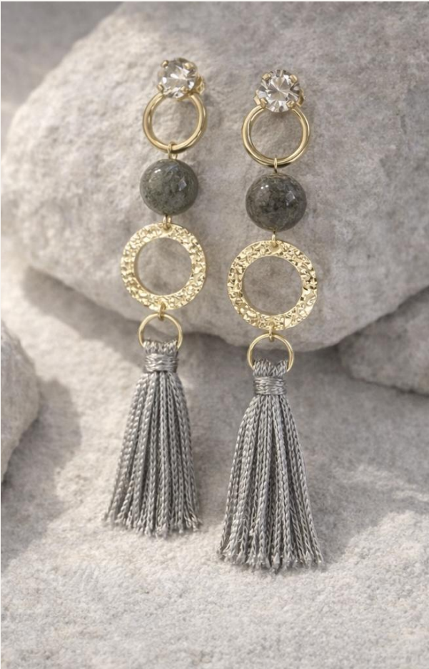
Pendiente Garra Eclipse (Dorado)