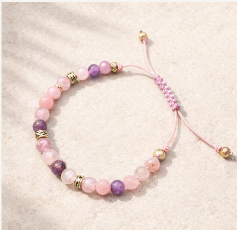
Pulsera Brisa Rosa Jaspe

Diseño ajustable y ligero para el día a día