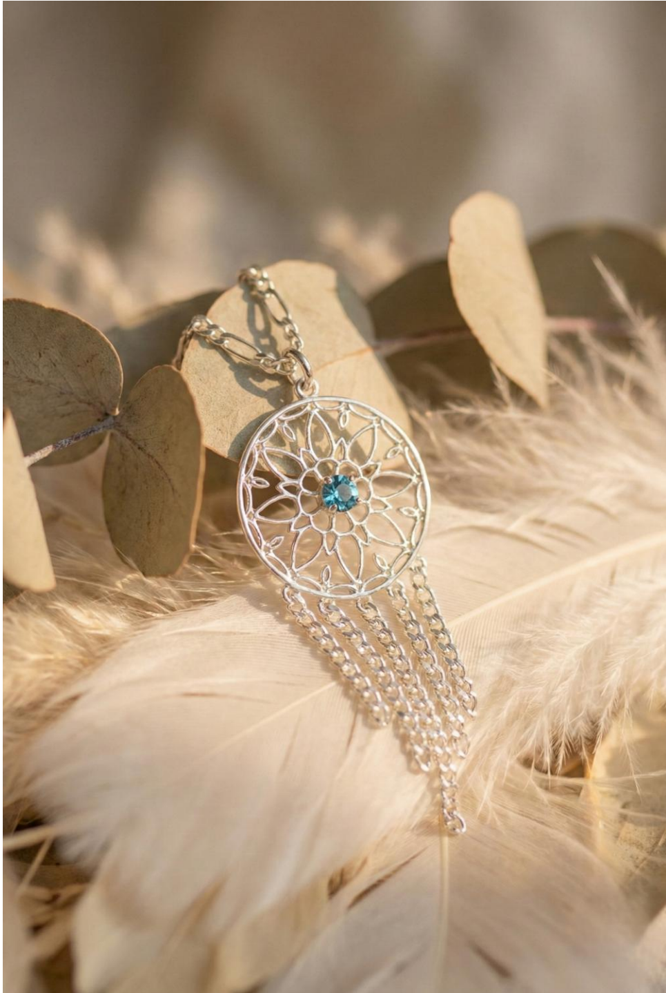
Collar con flor Atrapasueños y cristal Azul